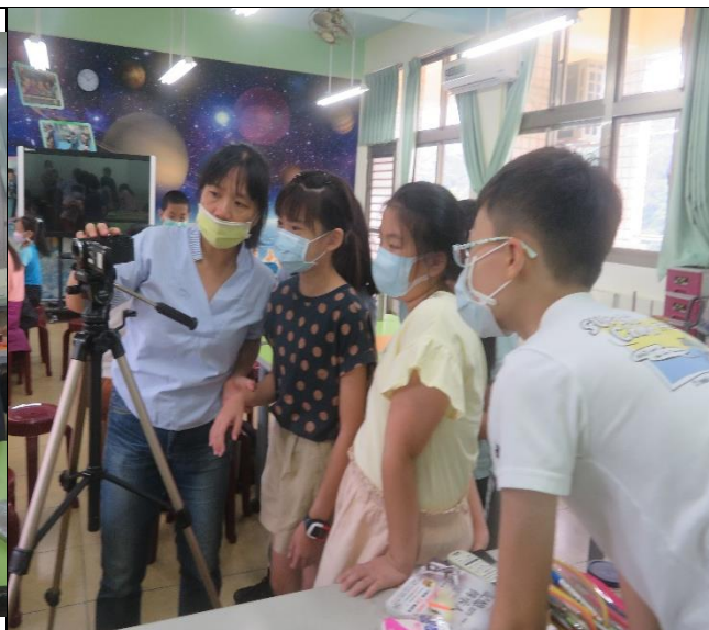
老師介紹攝影機操作