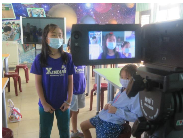
同學國語正音練習+錄製