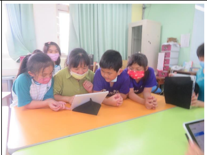
老師示範錄音操作