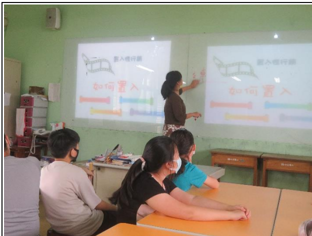
老師講授置入性廣告