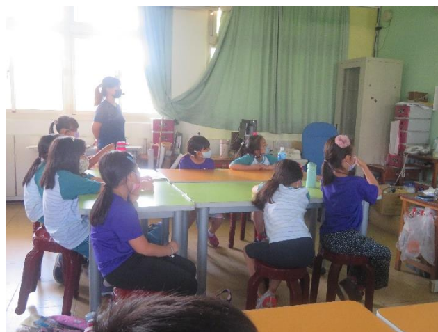
老師講授各種音效