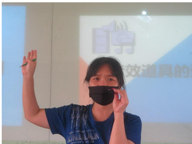
老師講授各種音效