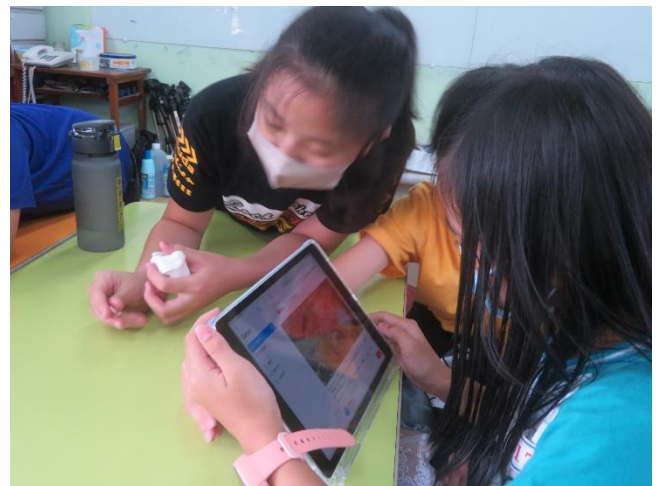
用平板設備錄製聲音