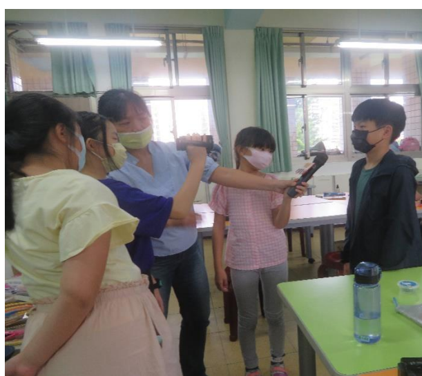
老師介紹攝影機操作