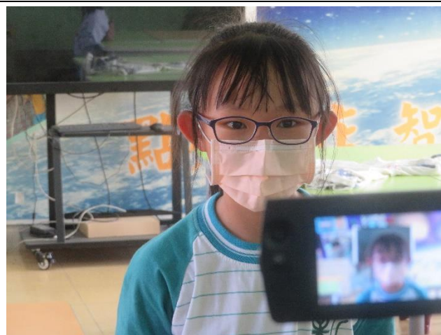
同學國語正音練習+錄製