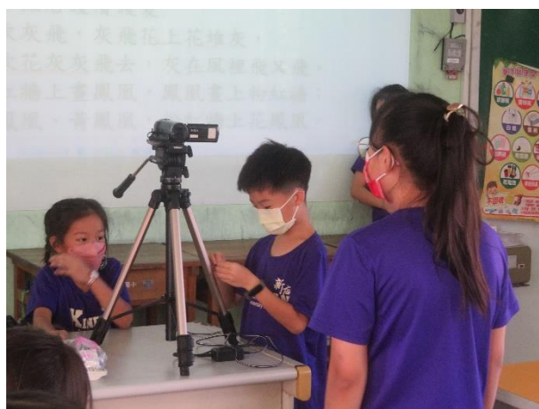
同學國語正音練習+錄製