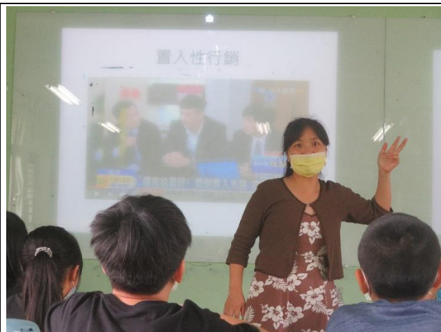
老師講授置入性廣告