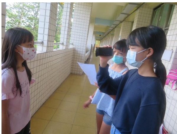
學生練習操做攝影機