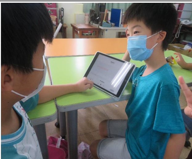
用平板設備錄製聲音