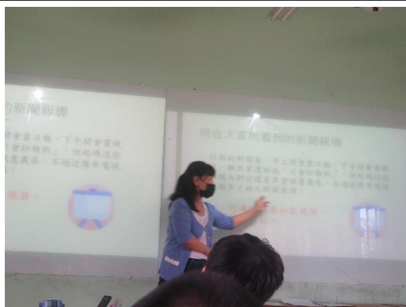
老師說明新聞如何製作