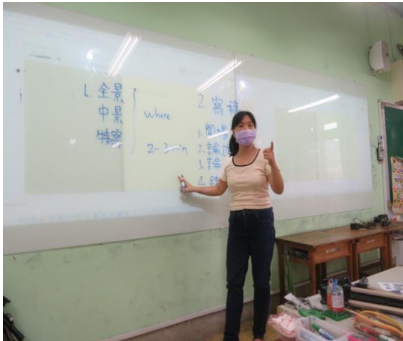
老師講授如何寫一篇新聞稿