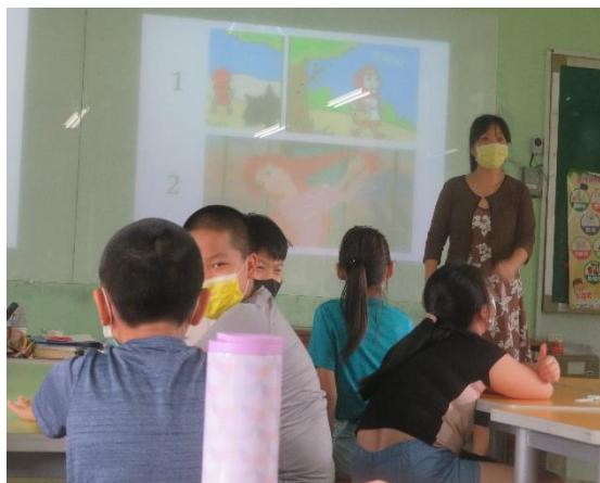
戲劇置入-小紅帽-你會如何置入