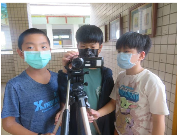
學生練習操做攝影機