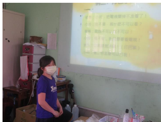
學生上台表演音效