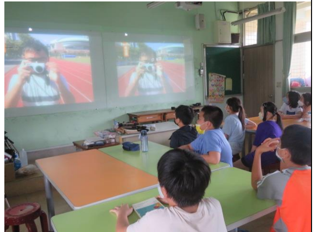
拍攝方式影片播放