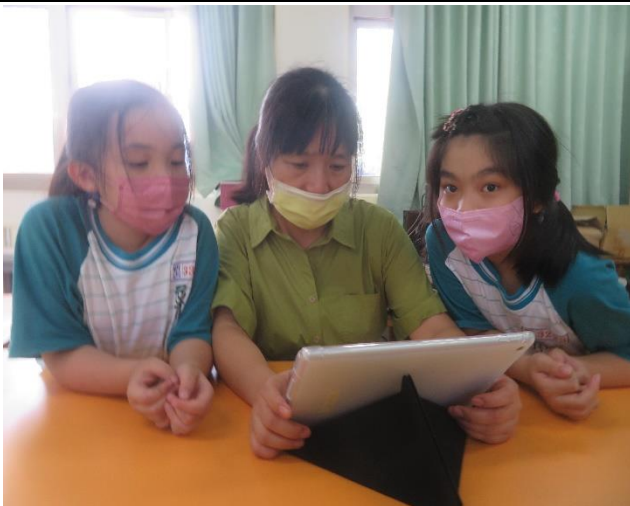
老師示範錄音操作