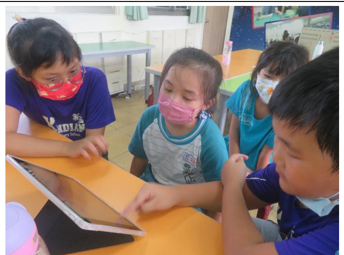
用平板設備錄製聲音