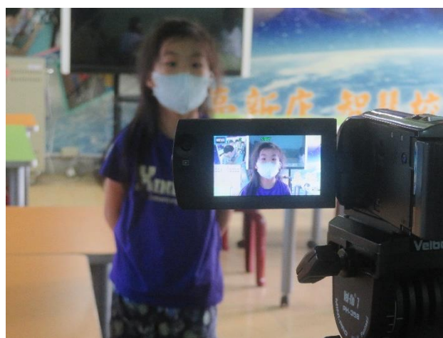
同學國語正音練習+錄製