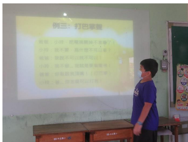
學生上台表演音效