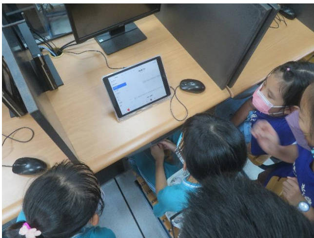
用平板設備錄製聲音