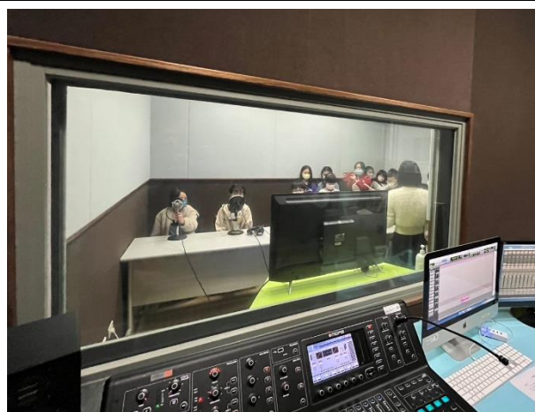
學生實際演練-廣播試音