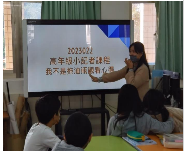
觀看影片-學生撰寫心得