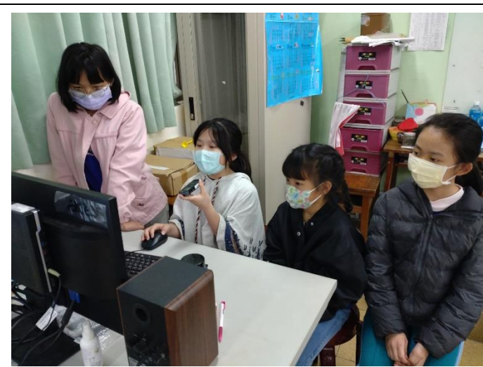
廣播主的知能學習 活動主題：廣播劇的創作