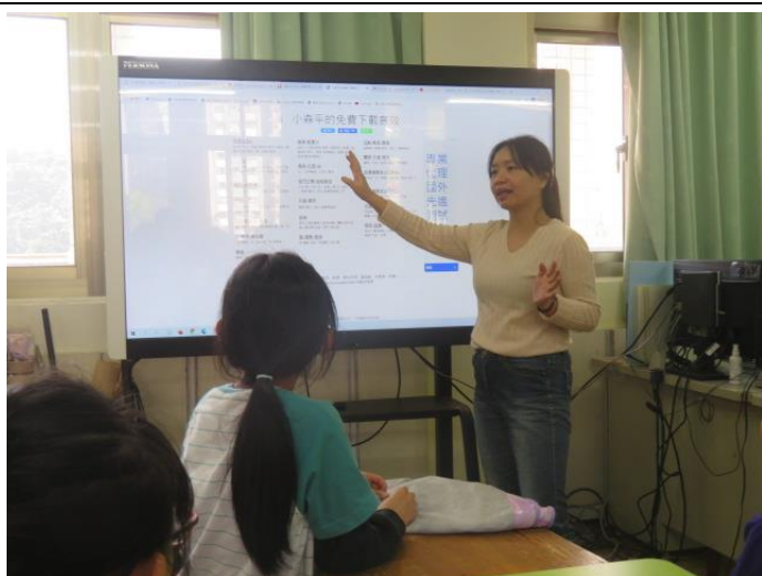
認識無版權音樂及音效網站