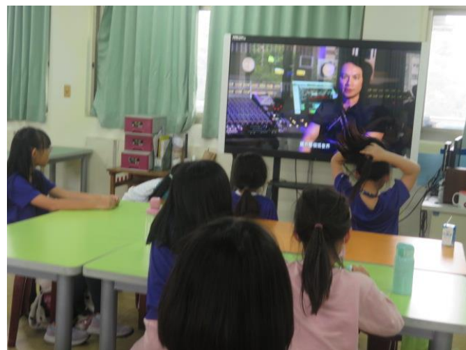
認識音樂及音效的創作