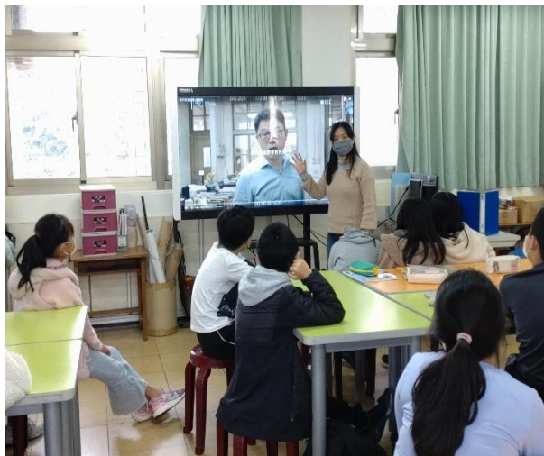
媒體識讀課程-老師說明網路霸凌