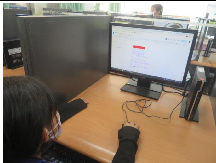
廣播劇本創作-小組討論共編