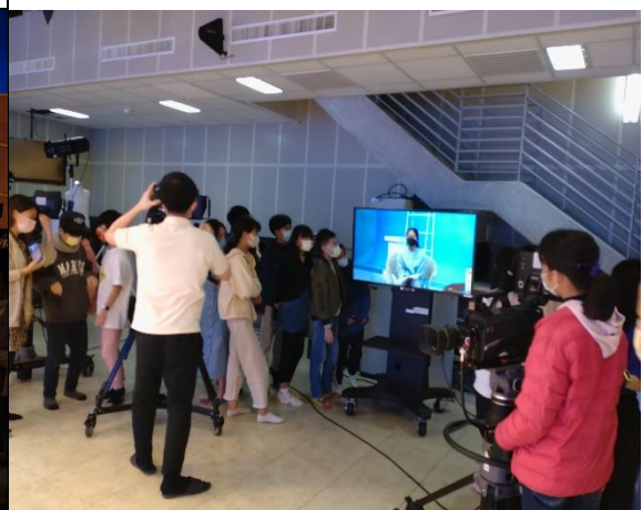
學生實際演練-導播組