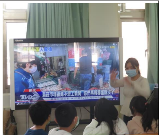
新聞報導-排隊搶購雞蛋