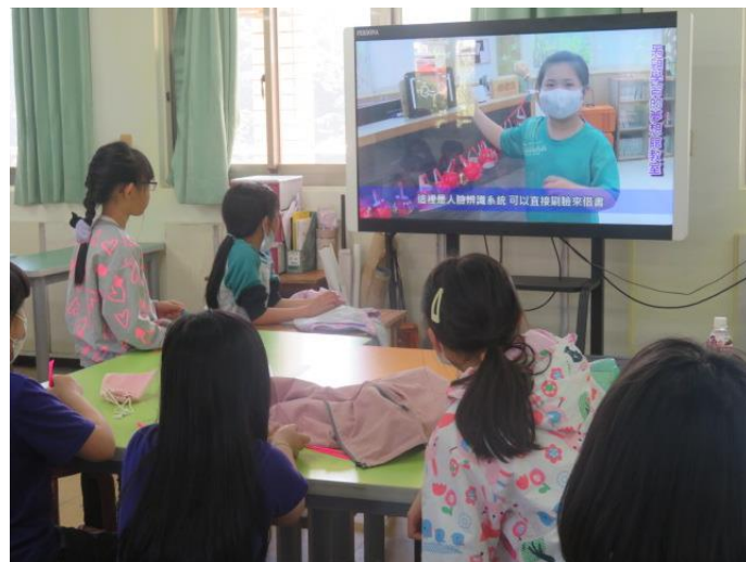
觀摩高年級學長姐製作的校園新聞報導