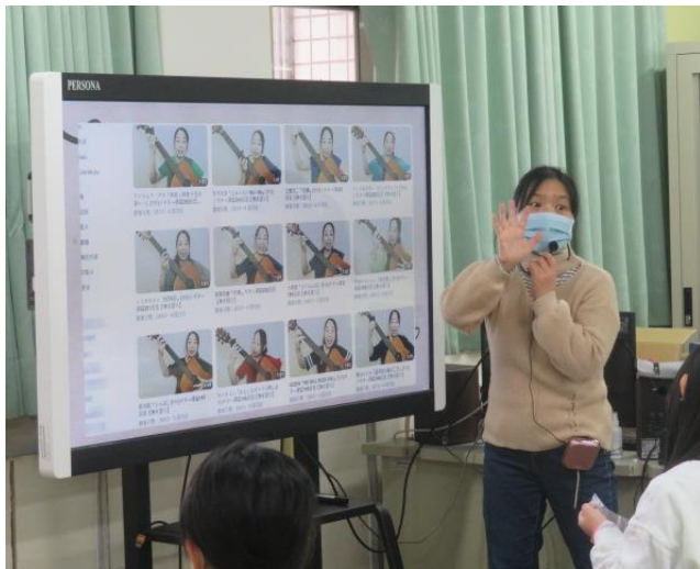
如何正確使用社交平台