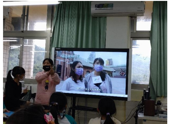
老師說明體有什麼樣的功能、扮演什麼樣的角色