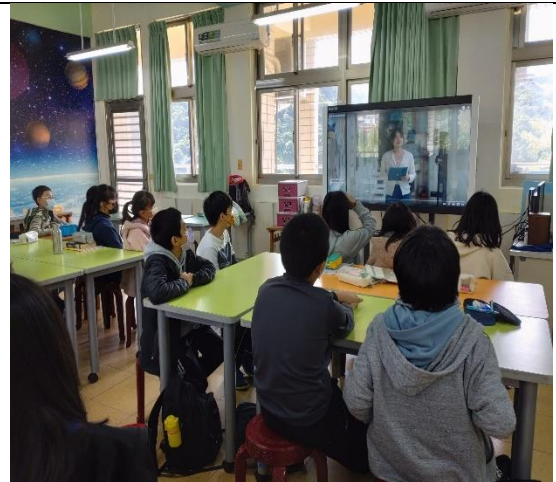
播放影片「我不是拖油瓶」