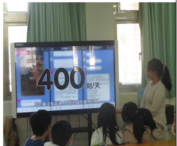
每天有超過四百則驚悚的訊息