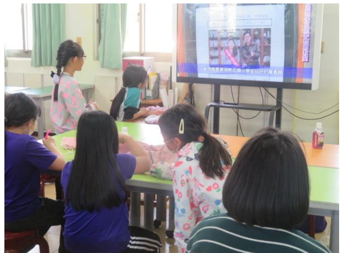
觀摩高年級學長姐製作的校園新聞報導