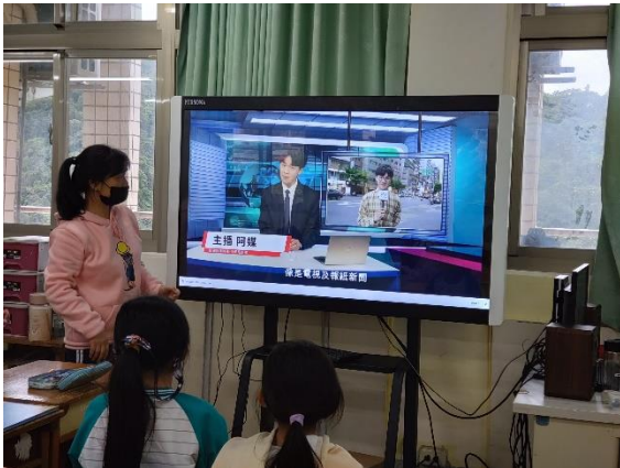
老師說明媒體有什麼樣的功能、扮演什麼樣的角色