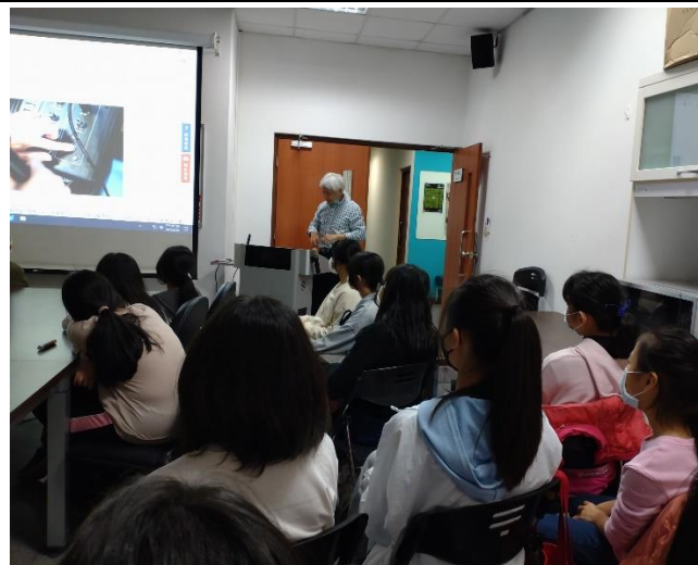
參訪台藝大廣電系-系主任說明