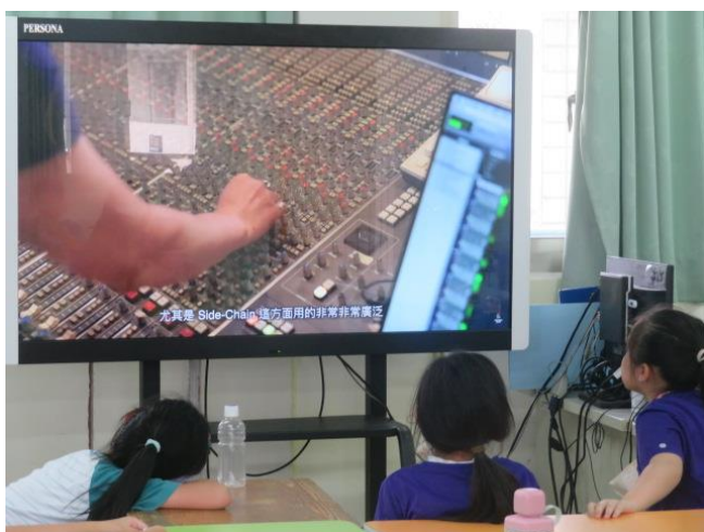
認識音樂及音效的創作