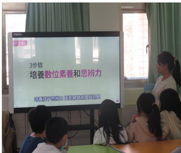
老師說明數位時代對資訊的思辨力