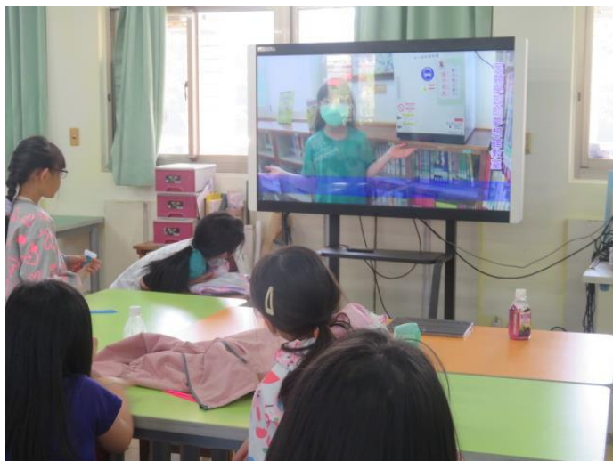
觀摩高年級學長姐製作的校園新聞報導