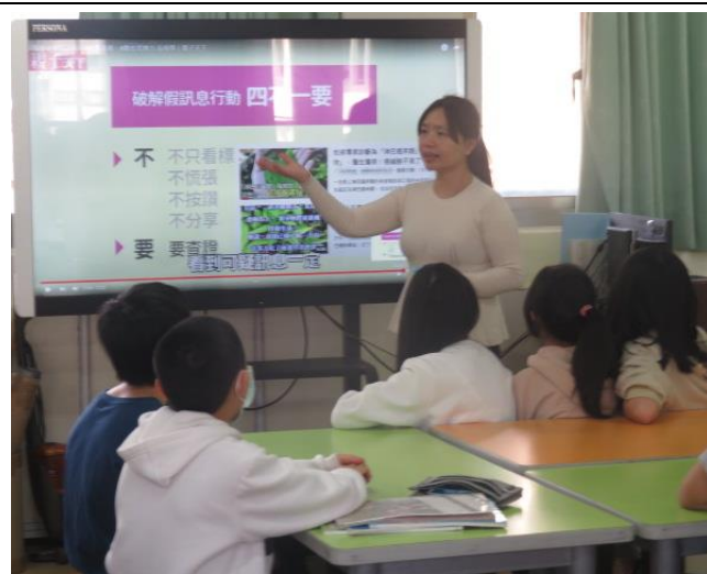
如何去思辨假訊息