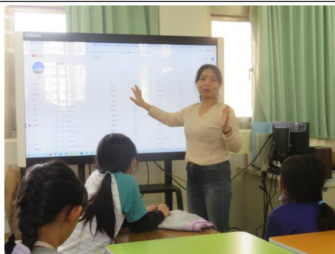
認識無版權音樂及音效網站