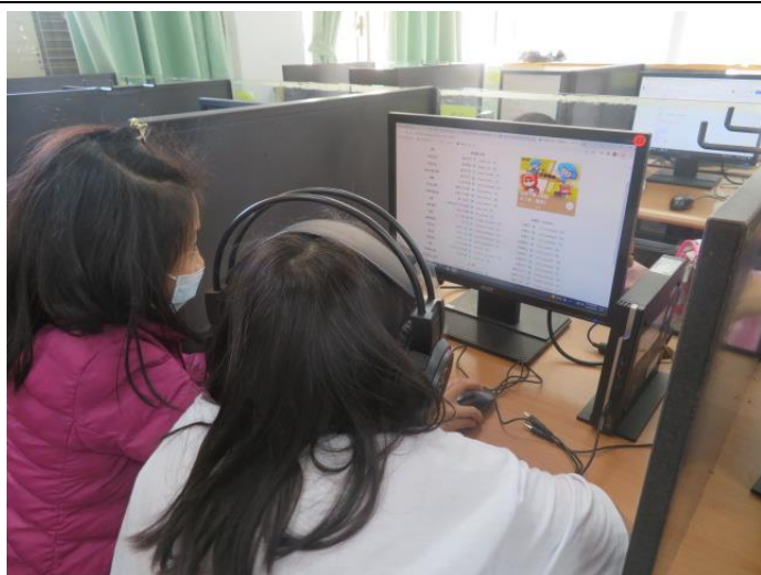
廣播劇本創作-小組討論共編