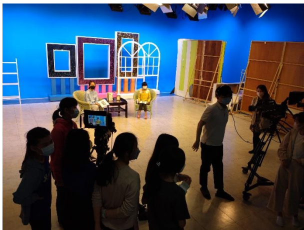
學生實際演練-主持人 VS 來賓