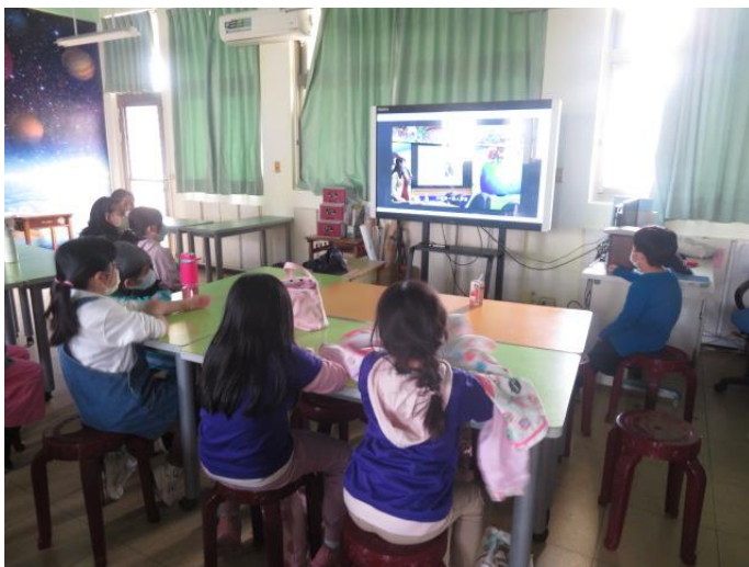
觀摩高年級學長姐製作的校園新聞報導