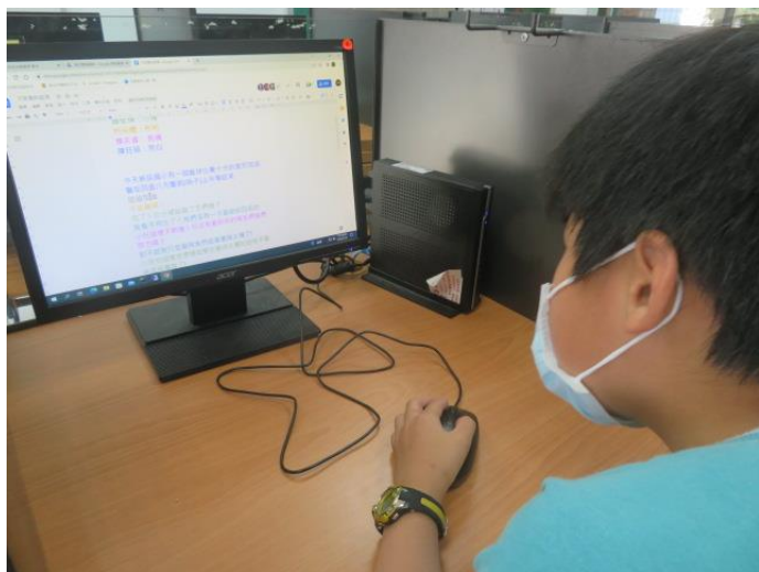
廣播劇本創作-小組討論共編