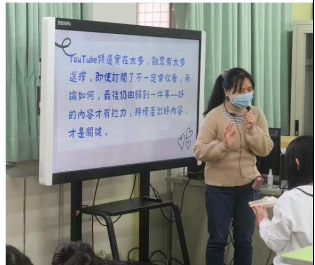
學生練習操做攝影機