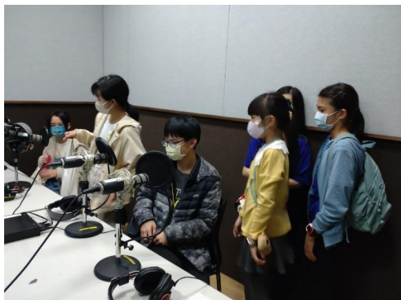
學生實際演練-廣播試音