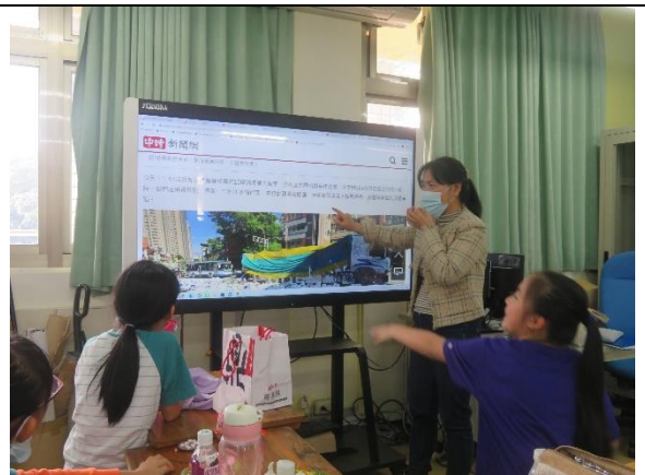
從一則新店在地即時報導說新聞