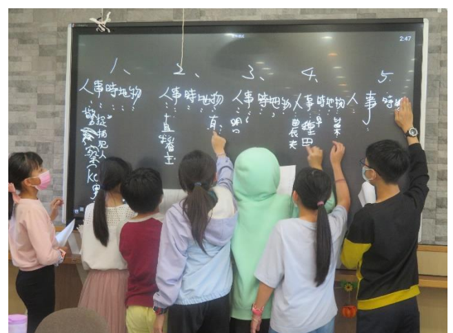
學生上台發表討論結果