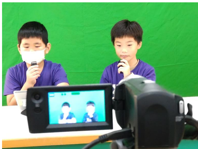
正式錄製-跟著捷運旅行去