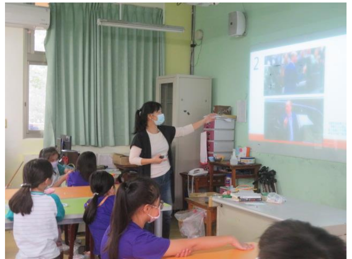
媒體識讀課程-媒體如何操弄人心