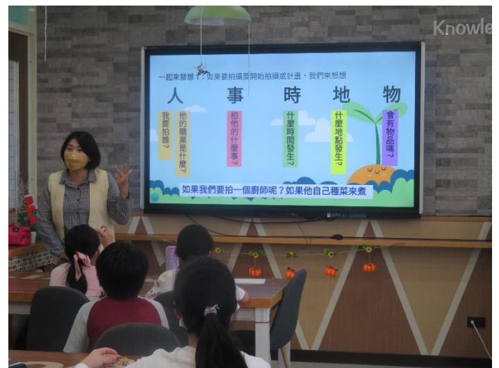
如何發想記錄篇拍攝主題