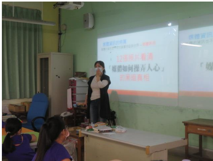
媒體識讀課程-媒體如何操弄人心