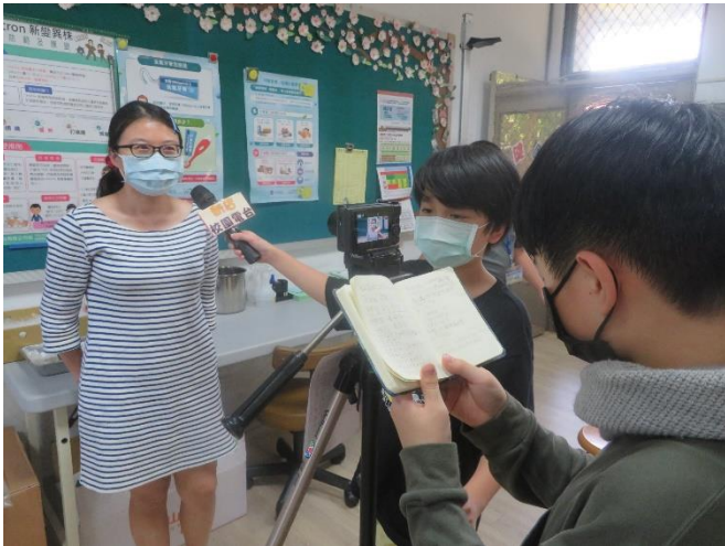
受訪者接受學生採訪一