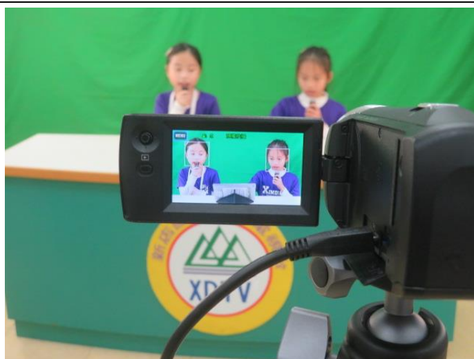
正式錄製-跟著捷運旅行去