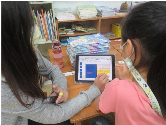
學生討論報導內容