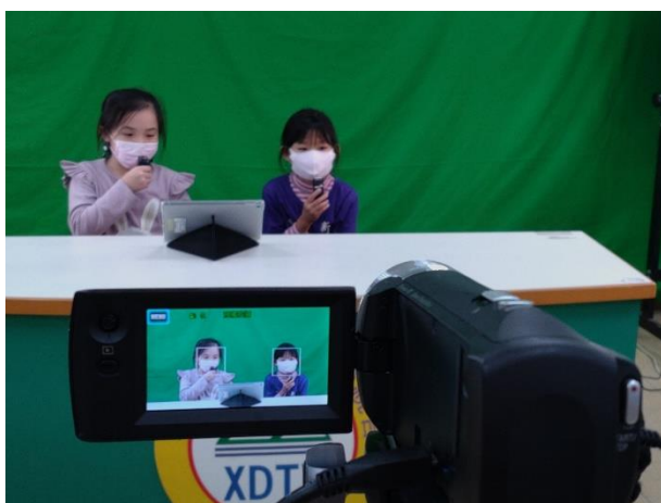
正式錄製-跟著捷運旅行去