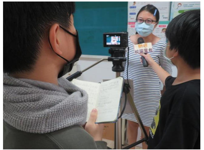
受訪者接受學生採訪二