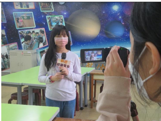
學生進行小主播報導