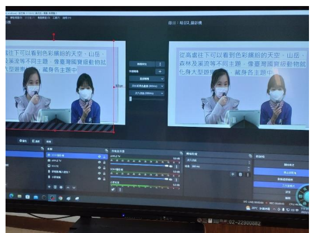
正式錄製-跟著捷運旅行去