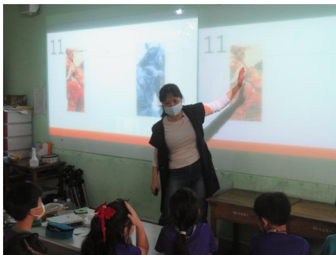
媒體識讀課程-媒體如何操弄人心