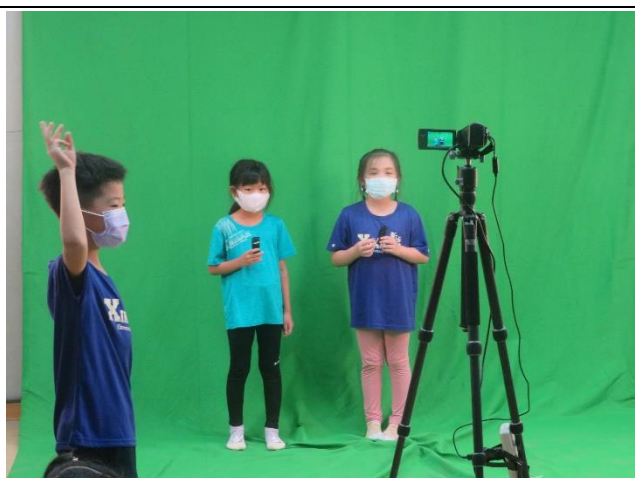
攝影棚-示範錄製攝影棚-示範錄製