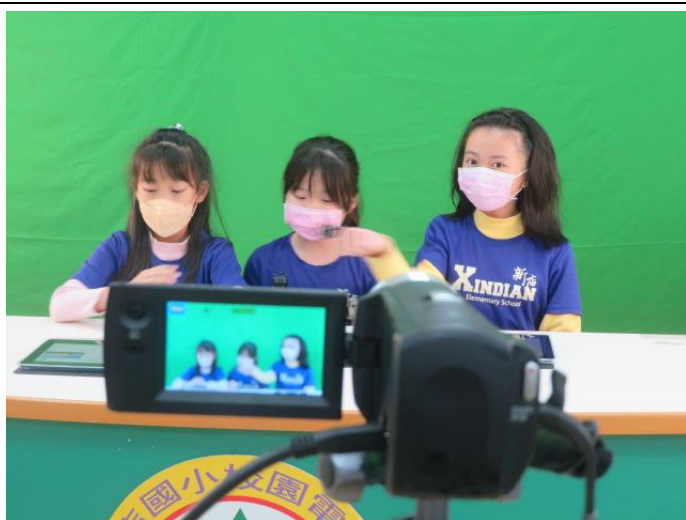
正式錄製-跟著捷運旅行去