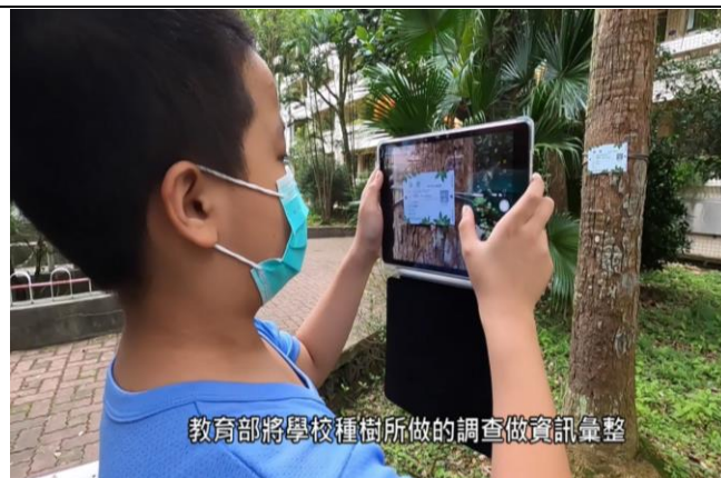
校內新聞報導-校園樹木