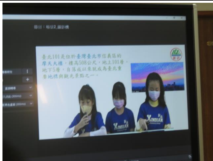
正式錄製-跟著捷運旅行去