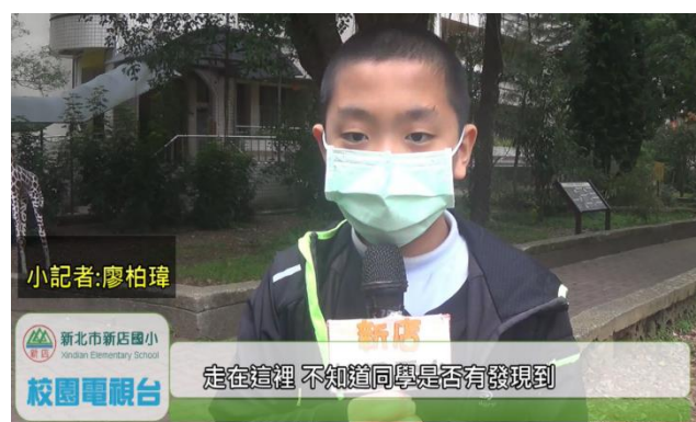
校內新聞報導-校園樹木