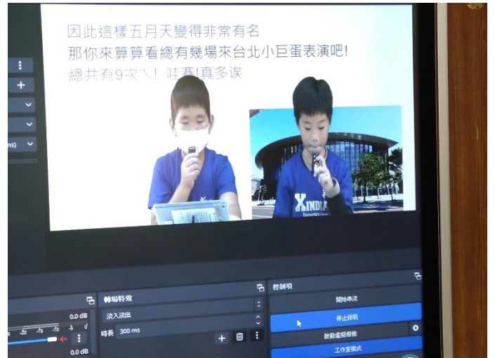
正式錄製-跟著捷運旅行去