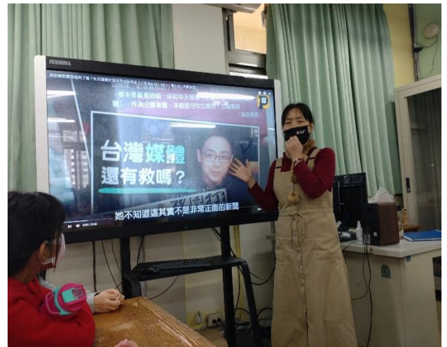
媒體識讀課程-媒體如何操弄人心