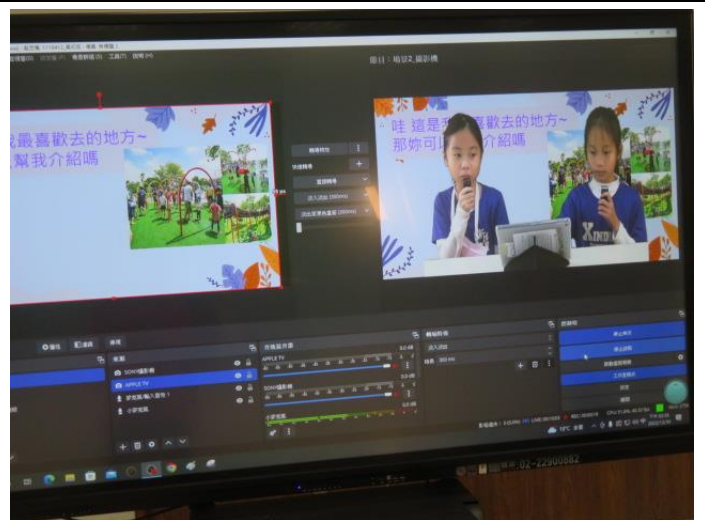
正式錄製-跟著捷運旅行去