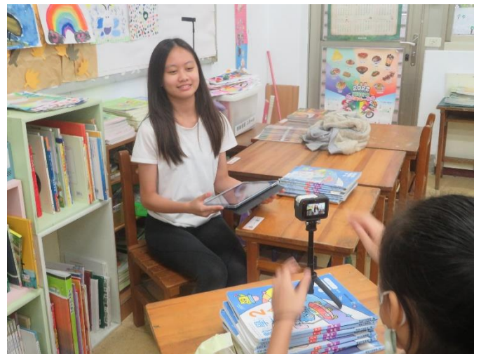
學生進行小主播報導