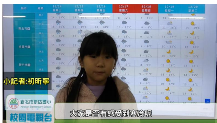
校內新聞報-寒流宣導